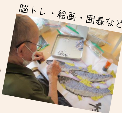
脳トレ・絵画・囲碁など