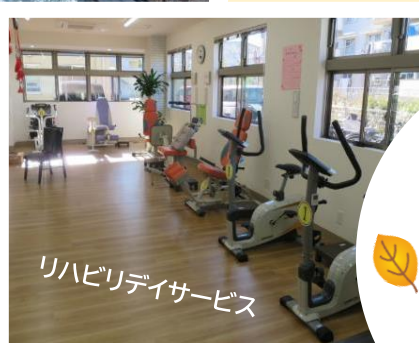
リハビリデイサービス