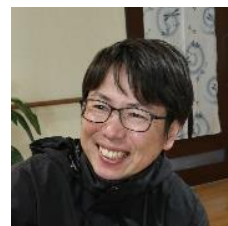
ご来場お待ちしております! 管理者: 濱 (ハマ)