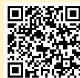
WEB見学はこちらから!