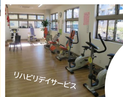
リハビリデイサービス