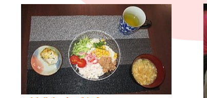
特製・色彩冷やしそうめん

ポート野芥では、地域の子ども会と七夕会を行いました。入居者の皆さん、短冊に色々な願い事を書かれていました。食べたい物や行きたい場所、欲しい物などを書かれており、入居者の皆さんの意外な一面も見ることが出来ました(笑) ポートに来てくれた子ども達の笑顔と元気な声に入居者の皆さん、スタッフもパワーをもらう事が出来ました！短冊には沢山の『夢』が書かれており、その夢を叶える為にも『夢実現』を実行していきたいと思っております。(計画作成担当者・福嶋)