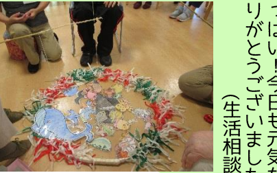
デイサービスセンター ラ・ポール有田