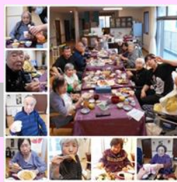
出前パーティー(特養)