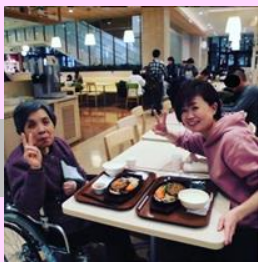
ショッピングモールへ(特養)