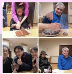
バレンタインデー(特養)