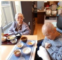
奥様とお食事(特養)