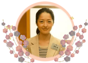
特別養護老人ホーム ラ・ポール有田