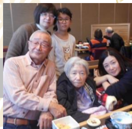
ご家族と外食(特養)