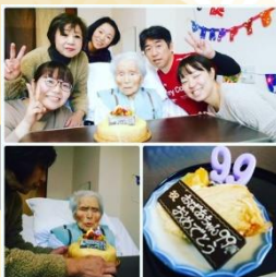
99歳のお誕生日(特養)