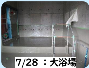
7/28 : 大浴場