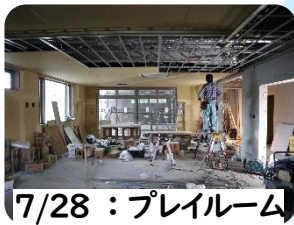
7/28 : プレイルーム