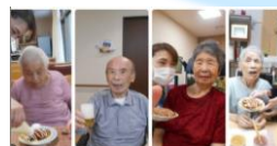
お好み焼きパーティ

他にも、楽しく過ごされているご入居者様の様子が、多数アップされています！是非、ご覧下さい♪