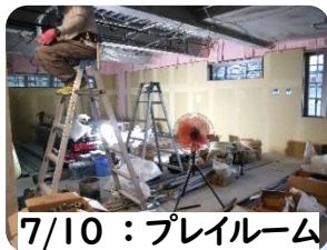
7/10 : プレイルーム