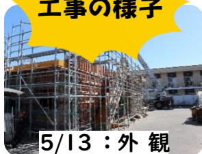
5/13 : 外観