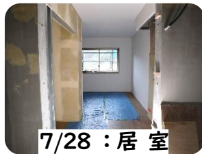
7/28 : 居室