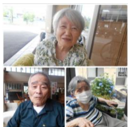
施設敷地内お散歩