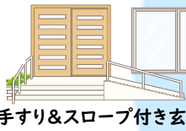
手すり&スロープ付き玄関