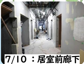
7/10 : 居室前廊下