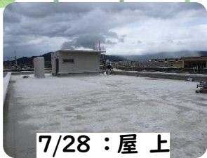
7/28 : 屋上