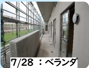
7/28 : ベランダ

おしゃべりをしたり、読書をしたり。思い思いの時間をお過ごし下さい。BBQやお祭りの企画も予定しております♪