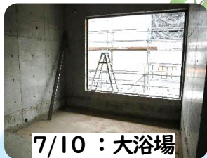
7/10 : 大浴場