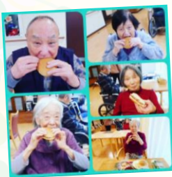
たまにはハンバーガー