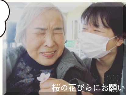
桜の花びらにお願い