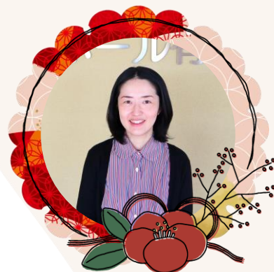
特別養護老人ホーム ラ・ポール有田