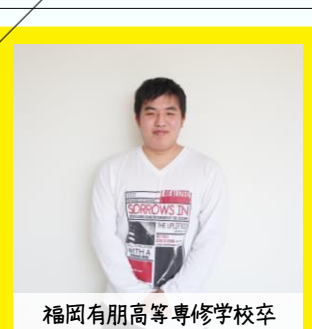
福岡有朋高等専修学校卒