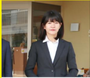
精華女子短期大学卒