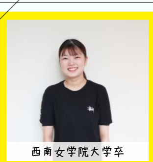
西南女学院大学卒