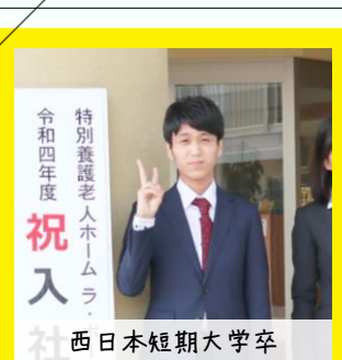
令和四年度 特別養護老人ホームラ 社 西日本短期大学卒