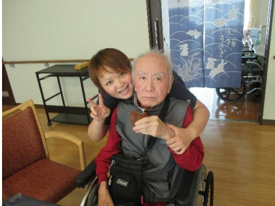
どらやきを頬張る入居者様と担当したスタッフ

特養・川上介護長より ご家族の皆様にはいつも、夢実現への協力誠にありがとうございます。私たちの取り組み『夢実現』とは、何も外出支援だけではありません。ご家族など大切な方と一緒に過ごす、何か挑戦する、ご馳走を食べる昔の友達に会いに行く、故郷を見に行きたいなど。私たちの出来る範囲でのお手伝いをさせていただきます。お気軽に職員までお声掛けください! 今後とも、宜しくお願い致します。