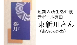
短期入所生活介護 ラ・ポール有田 東新川さん (ありあらかわ)

①利用者様一人一人日々変化 する状態に対応するのが、 まだまだ難しいと感じてい ます。毎日が同じ事の繰り返し ではなくて、ちょっとした状態の変化があれば看護師や管理栄養士 と連携して関わっていく事が難しくもあり、とても大切な事だと感じ ています。 ②入職前は「介護の仕事は利用者様との関わり」という印象が強 かったです。実際は、その方の生活習慣を把握するなど単に介護を するだけではありませんでした。御家族との関わりや他職種との連 携など、責任を伴うことが多いのだと感じるようになりました。 ③今年度は社会人として2年目の年となります。出来なかったことは 出来る様に、今年出来る様になったことも慣れて雑になってしまわ ないように、気を緩めずに頑張っていきたいです。