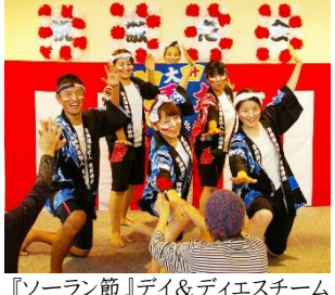
『ソーラン節』デイ&デイエスチーム