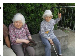
↑途中、おやつを食べながら休憩されるお二人

外出先の話題になり、油山の展望台の眺めが良かったという事で、「私も行きたい」と希望された。以前から、「あなたにはまだ連れていかね」と職員をご指名でドライブ。もう一人の方は、以前油山の麓に住んでいたとの事で、一緒にドライブへ行くことに。目的地に着くまでも、ないような「興味津々に外を見回す。展望台までは、少し道が悪く車酔いをお心配していましたが、悪路も楽しんでいました。悪眺めを見るときは、