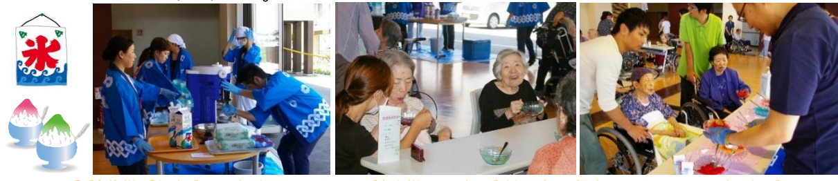
【ご家族様へ】行事ごとに写真を撮影しております、ご本人様のお写真をご希望の際は、担当ケアマネージャーにお申し出ください。

「頭がキーンとなられたようで顔をしかめられながらも、「夏はこれやね」と皆さん、終始笑顔で召し上がられていました。企画した栄養士は、「これから季節感のあるお食事を提供するだけでなく、私たちが入居者様とふれあひながら、季節を感じて頂くイベントも企画していきます。」と話していました。 「何にしようかなあ...」 「た。次回のイベントも楽しみですね。」 ラ・ポール管理栄養士、一富士フーodorサービス入居者主催で、かき氷大会が開催されました。シロップは定番のイチゴと抹茶ですが、トッピングが、練乳・フルーツカクテル・あずき・カラフルゼリー・水ようかんなどバラエティ豊かです！トッピングに悩みながら、結局は、全部のせられる方もいたり（笑）