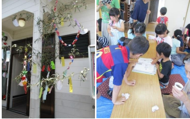
グループホーム ポート野芥