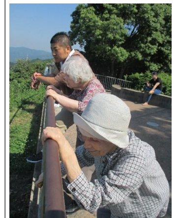
↑入居者様と職員3人並んで景色を堪能する様子

外出先の話題になり、油山の展望台の眺めが良かったという事で、「私も行きたい」と希望された。以前から、「あなたにはまだ連れていかね」と職員をご指名でドライブ。もう一人の方は、以前油山の麓に住んでいたとの事で、一緒にドライブへ行くことに。目的地に着くまでも、ないような「興味津々に外を見回す。展望台までは、少し道が悪く車酔いをお心配していましたが、悪路も楽しんでいました。悪眺めを見るときは、