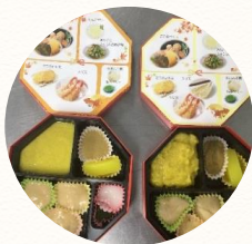
ゼリー食 ミキサー食